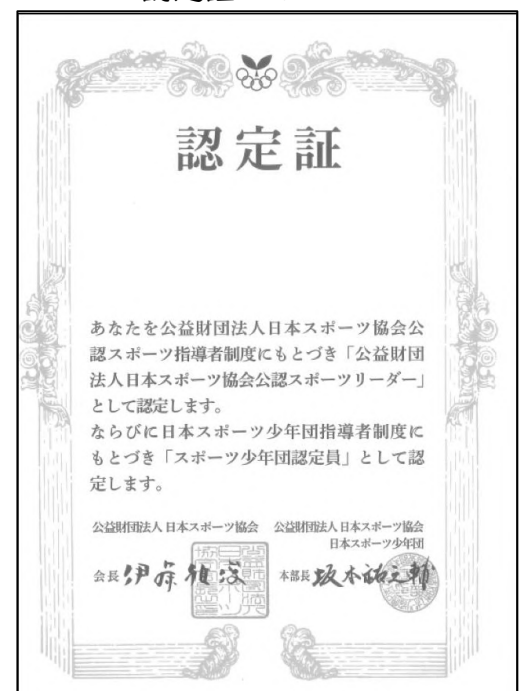
<認定証のイメージ>