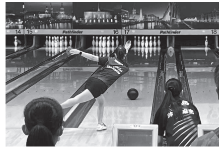
ボウリング少年女子