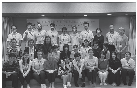
さよならパーティー

新型コロナウイルス感染症の影響により、群馬県としては、5年ぶりの受け入れとなりました。関東Iグループの中で唯一のホストファミリー泊のため、ドイツ団も来県を楽しみにしていたようです。地方プログラムでは、染色体験や東京農業大学第二高等学校で華道、書道、茶道、弓道、バレーボール等の部活動体験、博物館等様々な日本文化を体験してもらいました。地元の高校生との交流もあり、充実した5日間でした。