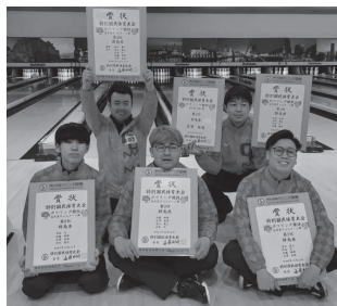
ボウリング 成年男子