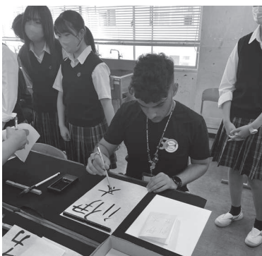
部活動見学_書道部体験