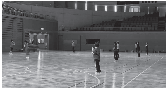
スローエアロビクス