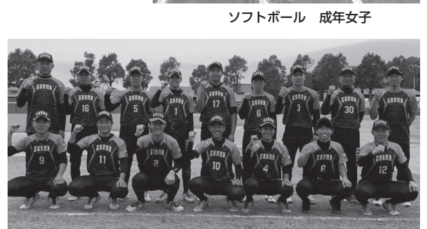
ソフトボール 少年男子