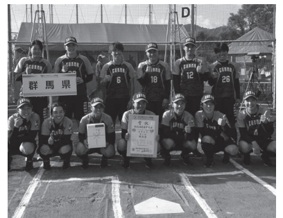
ソフトボール 成年女子