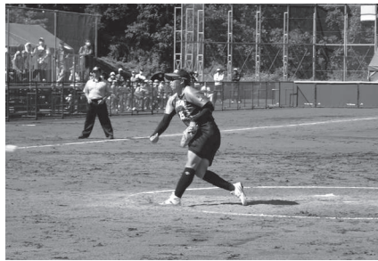
ソフトボール成年女子