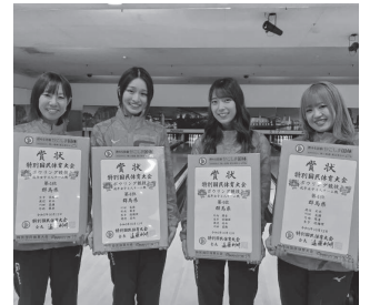
ボウリング 成年女子