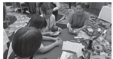
ウエルカムパーティー_折り紙交流