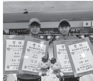
ボウリング 少年女子