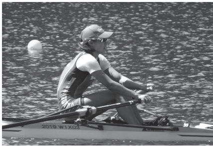
ローイング少年女子