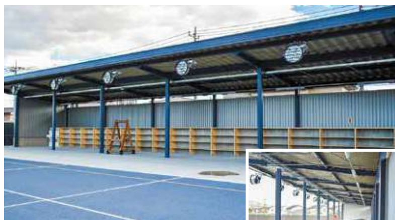
シューティングエリア シューティングエリアの後ろには立ち見席があり、見学もできます。