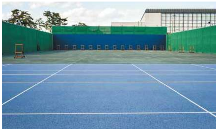
屋外練習場 最大90mまでの距離に的の設置が可能。アーチェリー競技大会会場としての利用も予定されています。