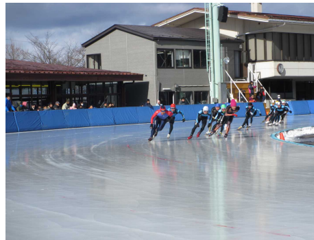
高校生によるスピードスケートレース