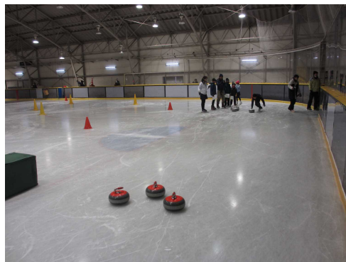
カーリングのストーンは思ったより重いです。