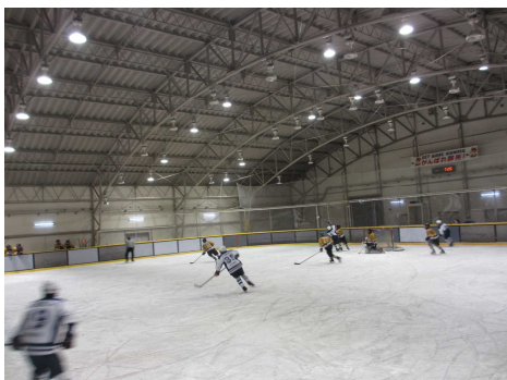
渋川工業高校 VS 高崎工業高校の試合

アイスホッケーとスピードスケートの試合のデモンストレーションを実施しました。 初めて見る試合に子どもたちは目を輝かせ、競技をしたいという小学生もいました。 目指せオリンピック！