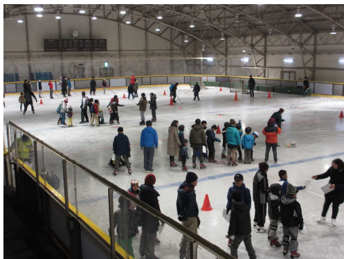
アトラクション全体の様子