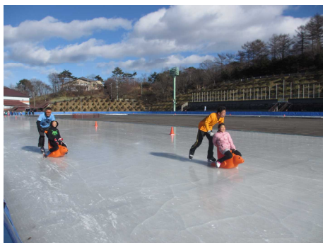
アシカ乗り物競争

100mスケート競争・アシカ乗り物競争・みんなでリレー競争を実施しました。 アシカ乗り物競争のお父さんは頑張りは素敵でした。